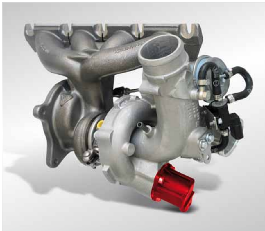
Zawór recyrkulacji powietrza (zaznaczony) na turbosprężarce Audi A3 2.0 TFSI