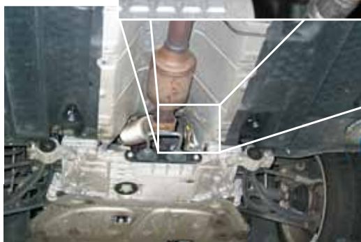
Zawór recyrkulacji powietrza w VW EOS TFSI (zaznaczony na czerwono)