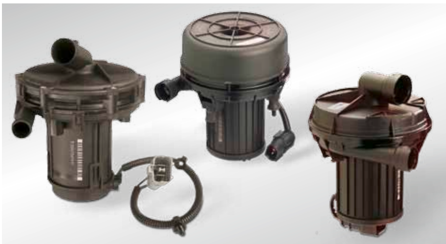
Pompy powietrza wtórnego 1 i 2 generacji

W celu umożliwienia kontroli przez system diagnostyczny pojazdu (OBD), zawór powietrza wtórnego można wyposażyć w zintegrowany czujnik ciśnienia.