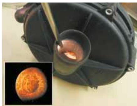
Skorodowany wlot pompy powietrza wtórnego