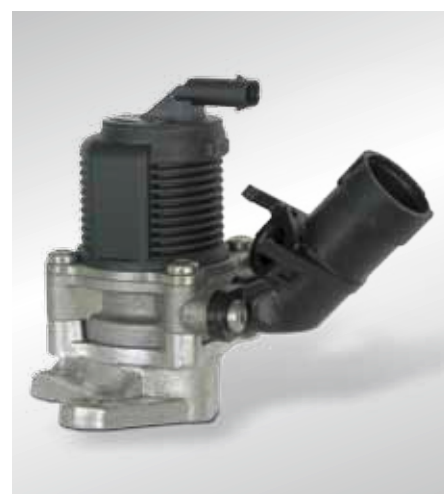
Elektryczny zawór powietrza wtórnego (od roku 2007)