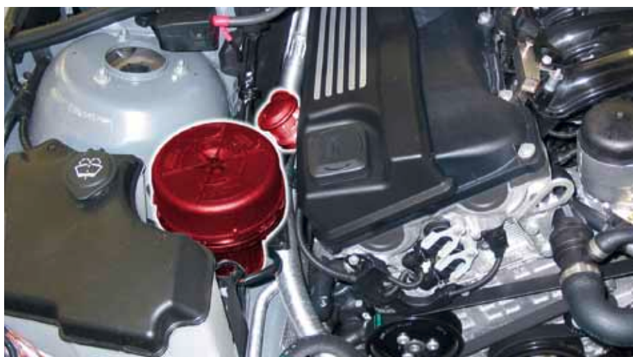
Zawór powietrza wtórnego i pompa powietrza wtórnego w BMW E46 (wyróżnione)

Zastrzegamy prawo do zmian i niedokładności zdjęć.