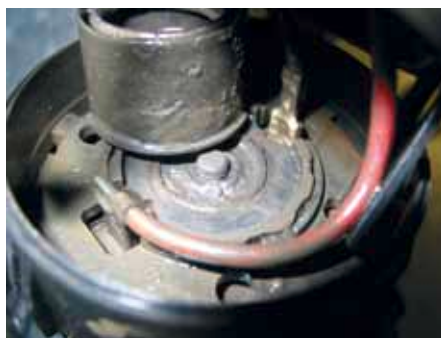
Agresywny chemicznie kondensat spalin w silniku napędzającym pompę powietrza wtórnego