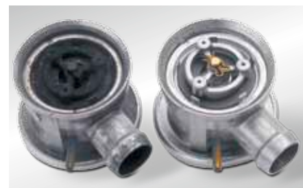
Otwarty zawór powietrza wtórnego z lewej: uszkodzenia spowodowane działaniem kondensatu spalin na prawej: stan fabryczny