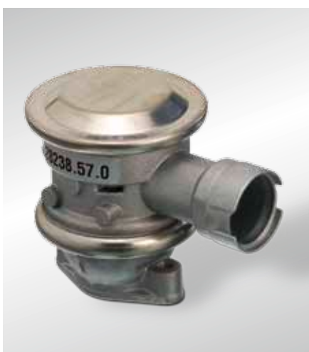
Wyłączany zawór zwrotny, sterowany ciśnieniem (od roku 1998)