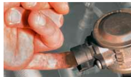
„Próba palcowa” zaworu powietrza wtórnego (wyróżniony) w BMW 520i. Jeżeli po tej stronie występują osady, oznacza to, że zawór zwrotny jest nieszczelny i należy go wymienić.