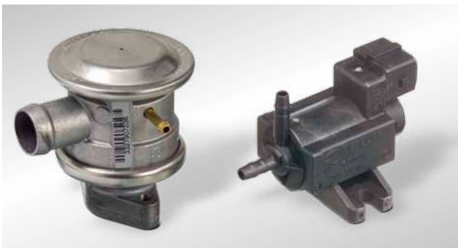
Sterowany podciśnieniowo wyłączany zawór zwrotny (od roku 1995) i elektryczny zawór przełączający