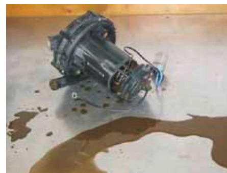
Płynny kondensat spalin usunięty z pompy powietrza wtórnego