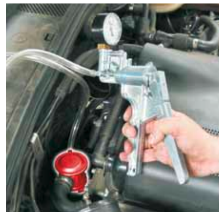
Kontrola zaworu powietrza wtórnego za pomocą ręcznej pompki podciśnienia