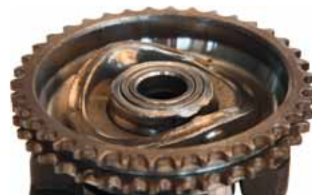
Zużyta tarcza krzywkowa