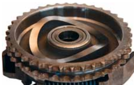
Prawidłowa tarcza krzywkowa

W celu oceny reklamacji należy nadesłać tarczę krzywkową.