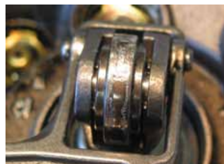
Obraz uszkodzenia: Wałek bieżny z karbami spowodowanymi przez zużyłą tarczę krzywkową