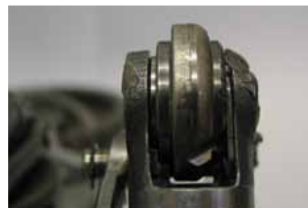
Obraz uszkodzenia: jednostronnie starty wałek bieżny

! Kosza montażowego (3) nie wolno montować przy montażu nowej pompy próżniowej.